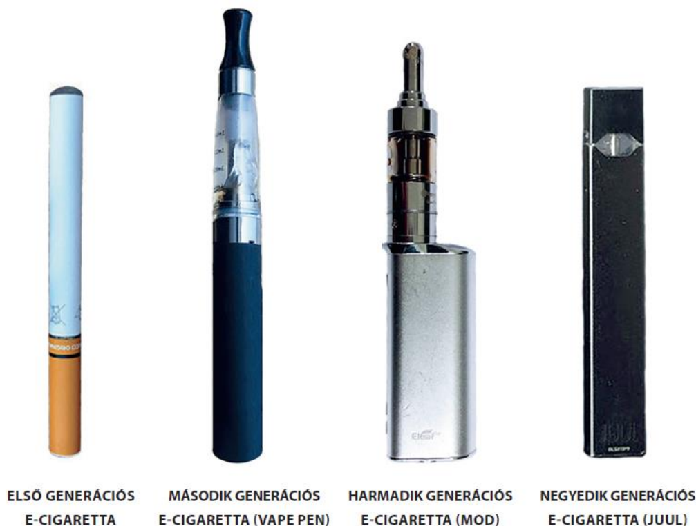
7 2. ábra: Az elektronikus cigaretták különböző generációi