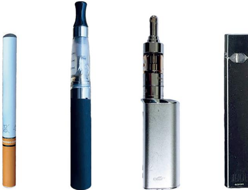
ELSŐ GENERÁCIÓS E-CIGARETTA